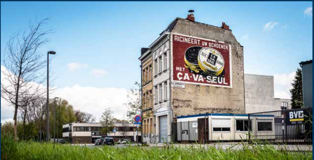
Fotograaf Jonathan Ramael vereeuwigde deze originele Ça Va Seul-gevelreclame in dit mooie beeld.