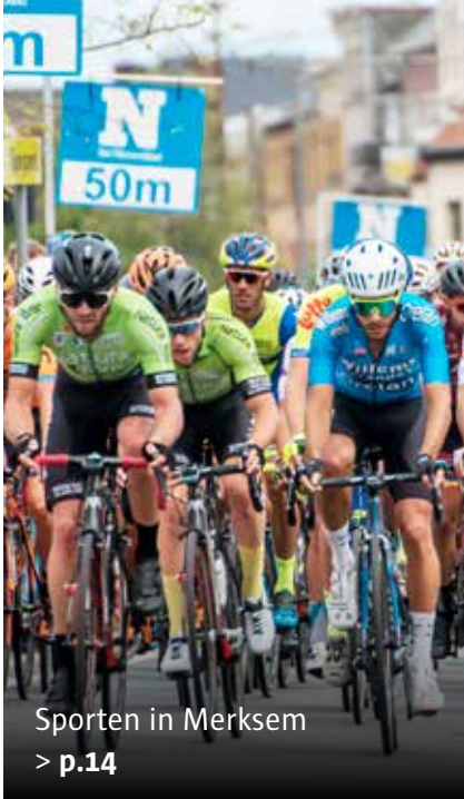
Sporten in Merksem