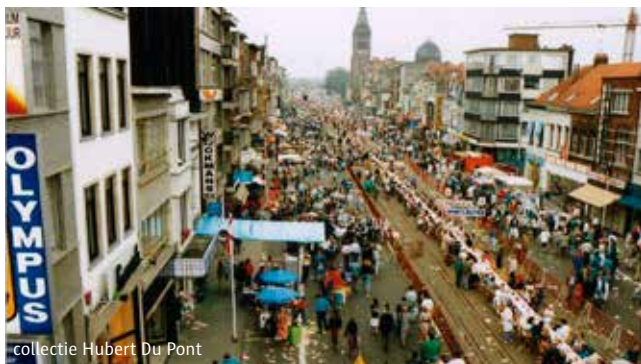
collectie Hubert Du Pont