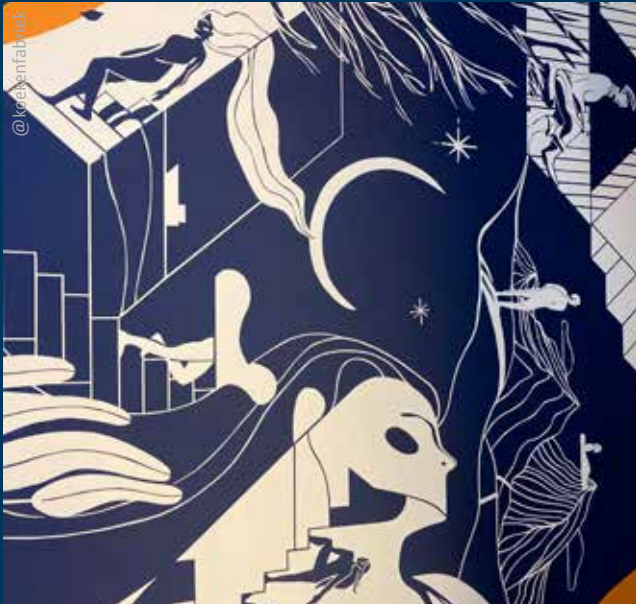
Sinds enkele maanden siert een inspirerende muurschildering de inkomhal van coworking De Koekenfabriek. Het ontwerp refereert naar de wijk het Dokske en staat symbool voor ondernemerschap. Een kijk op de wijk door het raam van De Koekenfabriek.